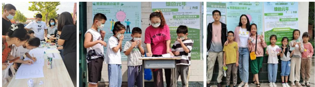
图 3 活动现场留念

在活动过程中，小分队向大家科普了全世界面临的环境污染和能源紧缺等重大问题，介绍了低碳环保的重要性和必要性以及国家“双碳”战略的内容和重大意义，宣传了低碳生活的方法和方式。另重点围绕农村的一些现实问题如秸秆、禽畜粪便、垃圾处理等开展了低碳宣讲，向村民介绍了秸秆和禽畜粪便低碳处理、垃圾分类处理等一系列措施会产生的经济效益和环境效益，并列举了大量的成功案例，成功地吸引了大量当地村民的兴趣（图 3）。