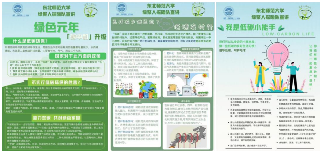
图 2 团队制作的低碳科普宣传海报

在活动过程中，小分队向大家科普了全世界面临的环境污染和能源紧缺等重大问题，介绍了低碳环保的重要性和必要性以及国家“双碳”战略的内容和重大意义，宣传了低碳生活的方法和方式。另重点围绕农村的一些现实问题如秸秆、禽畜粪便、垃圾处理等开展了低碳宣讲，向村民介绍了秸秆和禽畜粪便低碳处理、垃圾分类处理等一系列措施会产生的经济效益和环境效益，并列举了大量的成功案例，成功地吸引了大量当地村民的兴趣（图 3）。